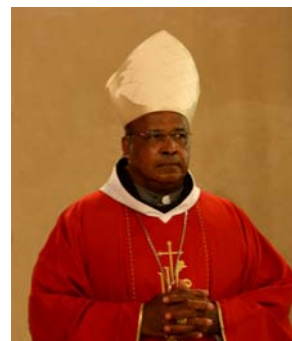
(L'invito del Cardinale Wilfrid Napier OFM, Arcivescovo di Durban)

Ricordatevi che l'unica vera vittoria è quella che custodisce la dignità della persona.