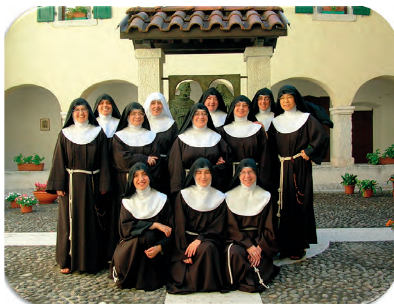
Le sorelle clarisse del monastero di Borgo Valsugana (TN), che hanno curato le riflessioni del calendario di quest'anno.