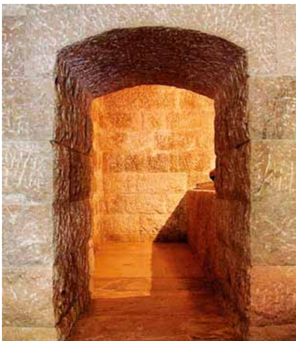
Dalla porta del Santo Sepolcro esce la luce del Risorto. È la porta da varcare per cominciare il cammino della fede. (Ricostruzione del Santo Sepolcro, Chiampo-VI).

Mese dopo mese lasciamoci coinvolgere sempre più nella chiamata che Gesù ci fa a seguirlo, a stare con Lui, a collaborare oggi perché la bella notizia del suo Vangelo continui ad essere annunciata, anche attraverso di noi, alle persone che ogni giorno Dio mette sulla nostra strada.